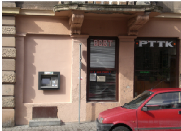
Nowy bankomat PBS w Łądku Zdroju na rogu Paderewskiego i Kościuszki