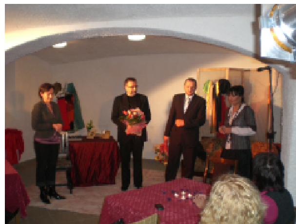
Alternatywny Dzień Kobiet w CKiR