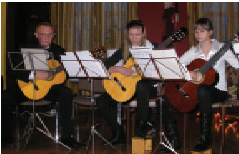
Wykonawcy i Prowadzący koncert