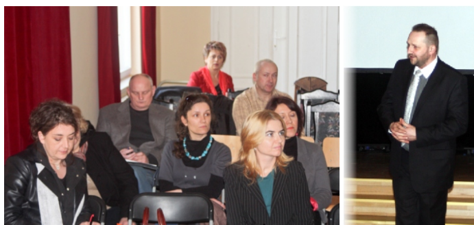
Uczestnicy spotkania poświęconego wspólnemu zaproszeniu rabatowemu