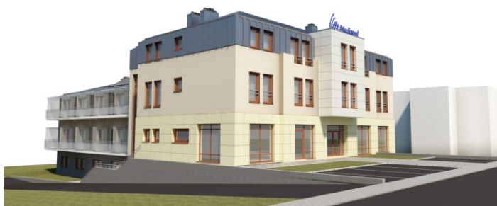
Wizualizacja Pensjonatu MEDIAPOL, Biuro Projektów BIMACO®