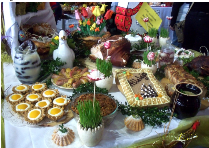
Stół Wielkanocny Koła Gospodyń Wiejskich w Trzebieszowicach