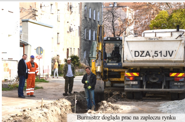
Burmistrz dogląda prac na zapleczu rynku

O charakterze części zdrojowej miasta decyduje w dużej mierze zieleń. To 4 parki, które są pod opieką Gminy. Dwa z nich – dzięki pozyskanym środkom unijnym – są już zrewitalizowane. W przyszłym roku będziemy odnawiać kolejny: Park im. Moniuszki. Na ten cel pozyskaliśmy w tym roku kolejne środki unijne. Zupełnie inna jest specyfika części staromiejskiej. Łądek posiada wyjątkowo urokliwy rynek. Dzięki Konserwatorowi Zabytków nie zepsuto go zabudową o współczesnym wyglądzie, jak to ma miejsce np. w Bystrzycy czy Kłodzku. Prace związane z poprawą wyglądu rynku trwają już od wielu lat. Najpierw przebudowa nawierzchni rynku – realizowana w ramach usuwania skutków powodzi w 1997 roku. Później odnowa kamienic na