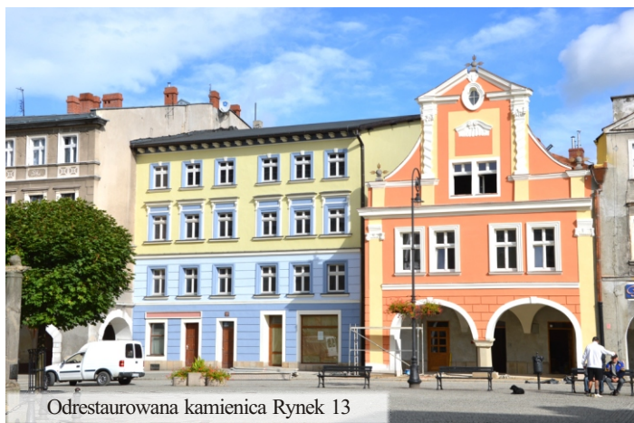
Odrestaurowana kamienica Rynek 13

Jednym z największych bogactw Łądku-Zdroju są liczne zabytki. Ich liczbą przewyższamy inne pobliskie kurorty. To konsekwencja tego, iż nasze miasto ma długą, liczącą kilkaset lat historię. Zabytki to nasze bogactwo i kłopot jednocześnie. Kłopot bo prace remontowe i renowacyjne są bardzo kosztowne. No i muszą być realizowane wg wytycznych Wojewódzkiego Konserwatora Zabytków, który decyduje o zakresie prac, stosowanych materiałach i technologiach.