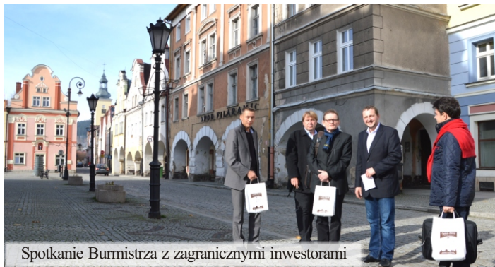
Spotkanie Burmistrza z zagranicznymi inwestorami

Nowe przeznaczenie Rynku 10 związane będzie z usługami turystycznymi. Inwestor w najbliższym czasie rozpocznie uzgodnienia z Konserwatorem Zabytków i prace projektowe. Wizerunek rynku to nie tylko kamienice. To też ich zaplecze. Pierwsze – bardzo złe wrażenie na odwiedzających nas turystach i kuracuszach robiło do tej pory zaplecze Rynku pomiędzy ul. Śnieżną i Strażacką. Szutrowa nawierzchnia rozsiewająca ogromne ilości kurzu latem i pokryta błotem i kałużami wczesną wiosną czy jesienią, była złą reklamą rynku. Była też wyjątkowo uciążliwa dla mieszkańców. Stąd decyzja by uporządkować to wstydlive miejsce. I w tej chwili to się dzieje. Powstaje nowy chodnik, będzie nowe oświetlenie i nawierzchnia z kostki granitowej dla samochodów. Rynek zyska w oczach turystów, łatwiej będzie mieszkańcom. To bardzo ważne przedsięwzięcie jest finansowane z wygospodarowanych w tym roku w budżecie Gminy środków własnych. Podkreślenia wymaga też fakt, iż w poprawę wizerunku części staromiejskiej miasta coraz częściej angażują się wspólnoty mieszkaniowe. W niektórych z nich swoje udziały posiada Gmina. Staramy się wtedy wspierać działania prywatnych właścicieli. Na przykład w pięknie wyremontowanej kamienicy Zdrojowa 8 Gmina posiada aż 60% udziałów. W takim też stopniu łóżymy na tamtejszy fundusz remontowy.