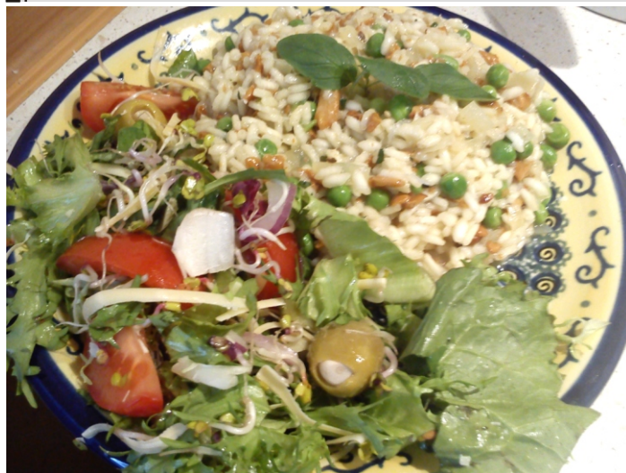
Propozycja podania z salatką