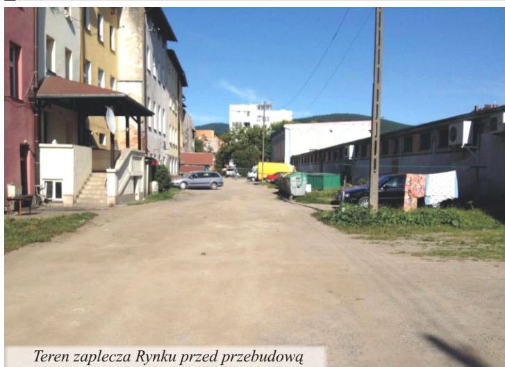
Teren zaplecza Rynku przed przebudową