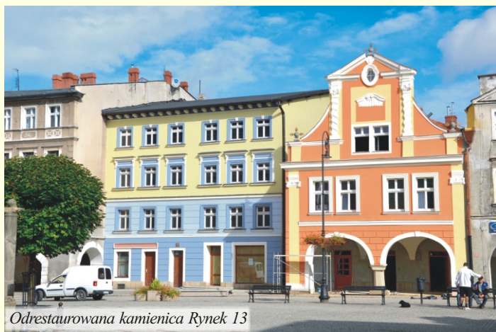
Odrestaurowana kamienica Rynek 13