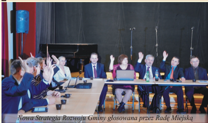
Nowa Strategia Rozwoju Gminy głosowana przez Radę Miejską