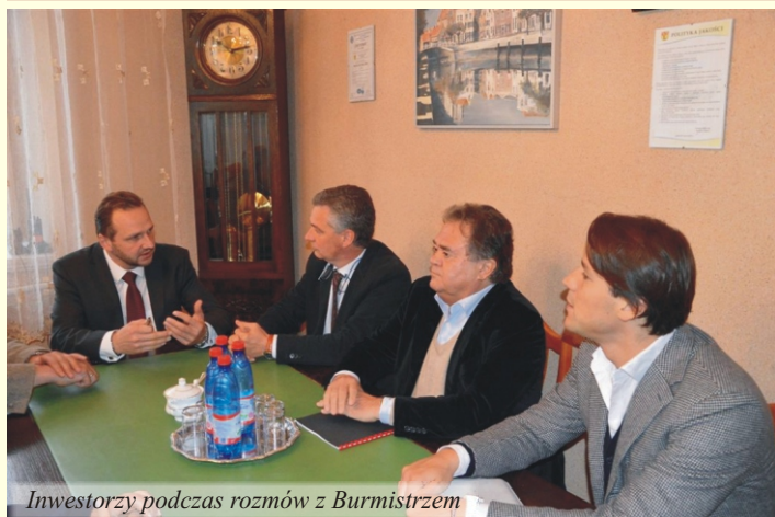
Inwestorzy podczas rozmów z Burmistrzem

Wykorzystanie zasobu wód geotermalnych na cele rekreacyjne to temat budzący wiele emocji. Można by rzec, gorący jak woda, którą chcemy wydobywać z wnętrza ziemi. Teoretycznie sprawa jest bardzo prosta: skoro w Łądku mamy naturalne źródła wody termalnej, którą wykorzystuje uzdrowisko, to trzeba zrobić odwiert, zbudować baseny i gotowe. Jest to jednak bardzo duże uproszczenie, bo sprawa jest bardziej skomplikowana.