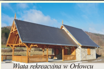
Wiatra rekreacyjna w Orłowcu

Powoli kończy się 2013 rok. Jaki był dla Gminy Łądek-Zdrój? Dość intensywny. Pozwólcie, że podsumuję ten rok, przynajmniej jeśli chodzi o sprawy, moim zdaniem, najciekawsze i najistotniejsze.