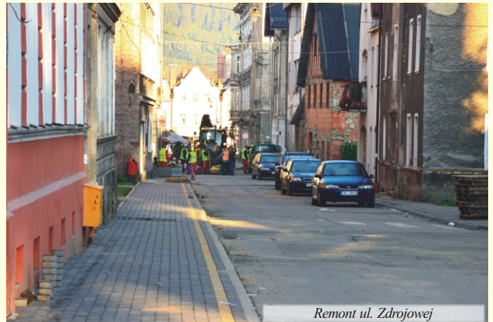
Remont ul. Zdrojowej

Ulica Słoneczna, choć niewielka, dla budowlanców jest nie lada wyzwaniem. Ulica jest przebudowywana, bo jej nawierzchnia była już w bardzo opłakanym stanie. A stanowi ona dojazd nie tylko dla mieszkańców pobliskich domów ale też dla korzystających z naszej stacji narciarskiej. Ale prawdziwym wyzwaniem nie jest nawierzchnia, tylko to co znajduje się pod nią. W tej wąskiej ulicy biegnie sieć kanalizacyjna, dwie magistrale wodociągowe i gazociąg. Przed wykonaniem nowej nawierzchni położono dwie nowe sieci wodociągowe i nową sieć gazową. Wymiana tych sieci to przede wszystkim wyzwanie organizacyjne. Na głębokości około dwóch metrów trzeba było położyć w drodze nowe sieci, wykonać nowe przyłącza i dokonać przebiegu nowych sieci w miejsce starych. A wszystko to w taki sposób, by zapewnić w miarę możliwości dojazd do posesji i zasilenie w wodę. Dlatego dla osoby patrzącej z boku, drogę wielokrotnie rozkopywano i zasypywano. I niestety wszystko trwało bardzo długo.