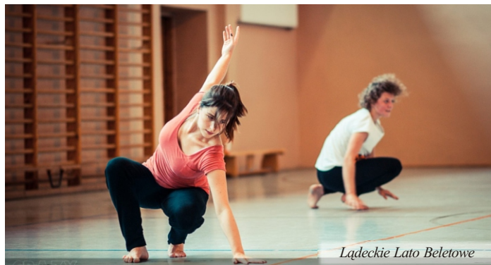
Łądeckie Lato Baletowe

kanwie średniowiecznej legendy celtyckiej i wystawiony przy pomocy środków teatralnych nawiązujących do tradycyjnego teatru japońskiego.