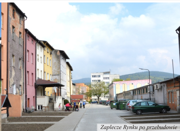
Zaplecze Rynku po przebudowie

Zakończyły się, rozpoczęte jeszcze w roku ubiegłym prace związane z zagospodarowaniem zaplecza Rynku pomiędzy ulicami Śnieżną i Strażacką. To zadanie to kolejny etap rewitalizacji części staromiejskiej naszego miasta. Efekt wizualny jest widoczny dla każdego, kto od ul. Zdrojowej wchodzi na Rynek. Oczywiście efekt wizualny to jeden z celów tego zadania, drugim równie ważnym była poprawa funkcjonalności tego miejsca dla mieszkańców przyległych kamienic. Jak podkreślają sami mieszkańcy, ten cel też został osiągnięty.