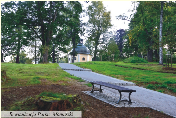
Rewitalizacja Parku Moniuszki

Wykonywane obecnie prace to pierwszy etap zadania. Jego koszt wyniesie blisko 240 tysięcy złotych. W ramach tej kwoty powstanie również zatoka parkingowa przy ul. Strażackiej (między Ogrodową i Zdrojową).