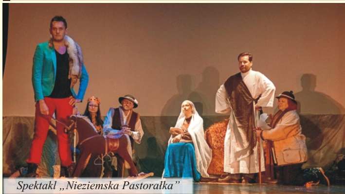
Spektakl „Nieziemska Pastoralka”