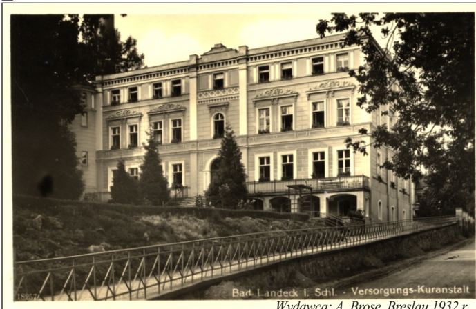
Bad. Łądek i. Szil. - Versorgungs-Kuranstalt Wydawca: A. Brosse, Breslau 1932 r.