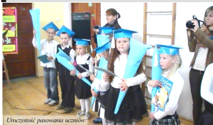
Uroczystość pasowania uczniów