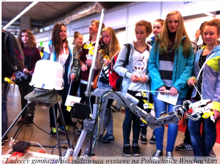
Łądeccy gimnazjaliści podziwiają wystawę na Politechnice Wrocławskiej