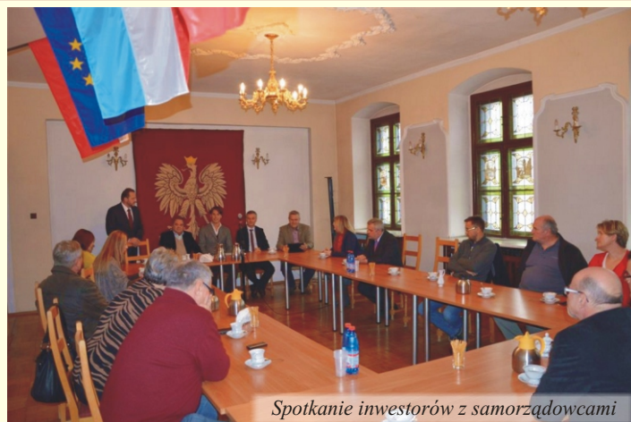
Spotkanie inwestorów z samorządowcami

Tego typu odwiert ponad 10 lat temu zafundowały sobie Duszniki-Zdrój. Ma głębokość około 1700 metrów, a uzyskane z niego woda ma temperaturę 37 °C. Spodziewano się oczywiście wyższej temperatury. Istnieje też inne zagrożenie, które można wykluczyć tylko przez próbną eksploatację odwiertu. Chodzi o groźbę, że eksploatacja tego odwiertu spowoduje spadek wydajności istniejących już ujęć wody, których używa tamtejsze uzdrowisko.