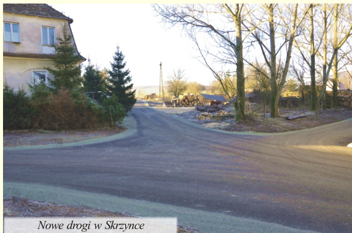
Nowe drogi w Skrzynce

W tej chwili przygotowujemy się do pozyskiwania nowych środków unijnych, które przeznaczone są na lata 2014-2020.