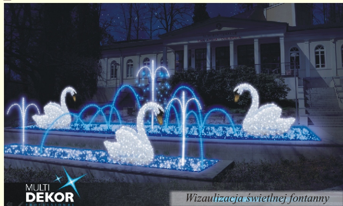
Wizualizacja świetlnej fontanny

W okresie zimowym, gdy wieczory są wyjątkowo długie, wyjątkowy klimat miasta tworzy oświetlenie świąteczne. Tak też jest w Łądku-Zdroju, gdzie konsekwentnie od kilku lat inwestujemy w zakup nowoczesnych ozdób świątecznych. Przyjęliśmy przy tym pewien styl, którego myślą przewodnią jest prostota co do formy, a przede wszystkim kolorystyki. Nadmiar kolorów źle wpisywałby się w klimat historycznego kurortu jakim jest Łądek-Zdrój. Stosujemy nowoczesne ozdoby ledowe. Nie należą one do najtańszych, ale za to są wyjątkowo trwałe i służą przez długie lata. Dzięki corocznym zakupom przed każdymi świętami jest ich więcej. Tak będzie też przed zbliżającymi się Świątami Bożego Narodzenia. Miasto ozdobią nowo zakupione elementy.