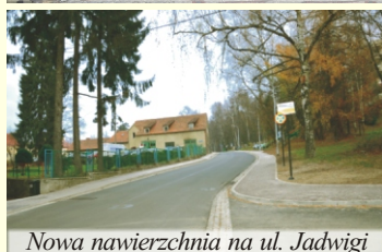
Nowa nawierzchnia na ul. Jadwigi