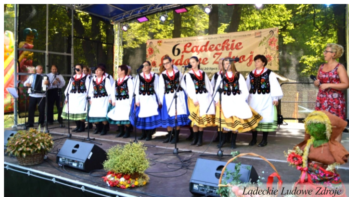
Łądeckie Ludowe Zdroje