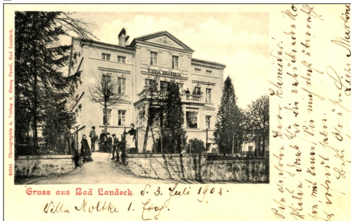
pocztówka datowana 3.07.1902 r.

W latach 50. I 60 XIX w. szybko postępowała rozbudowa uzdrowiska wokół kąpielisk „Jerzy” Georgen Bad i „Zdrój Wojciech” Marienbad. Obszar ówczesnego uzdrowiska stawał się zbyt ciasny, władze miasta nie chcąc zatrzymać rozwoju, przeznaczyły obszar dolnej części ptn. – wsch. stoku masywu Dziełca, stanowiącą głównie miejsce upraw rolniczych. Wytyczono nowe ulice (obecnie ul. Spacerowa, I. Paderewskiego, J. Bema, Miła oraz M. Konopnickiej i Cicha) i owalny plac Kaiser Wilhelm Platz (obecnie pl. Partyzantów). Zagospodarowywano zalesione tereny Dziełca na Park Leśny wytyczając tu promenady, urządzając miejsca widokowe.