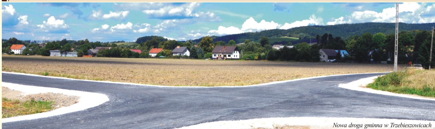
Nowa droga gminna w Trzebieszowicach