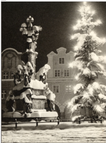
Wydawca: Foto Leister, Munchen 1937 r.