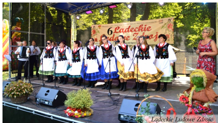
Łądeckie Ludowe Zdroje