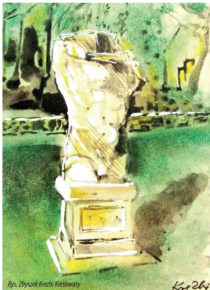
Rys. Zbyszek Kresowaty