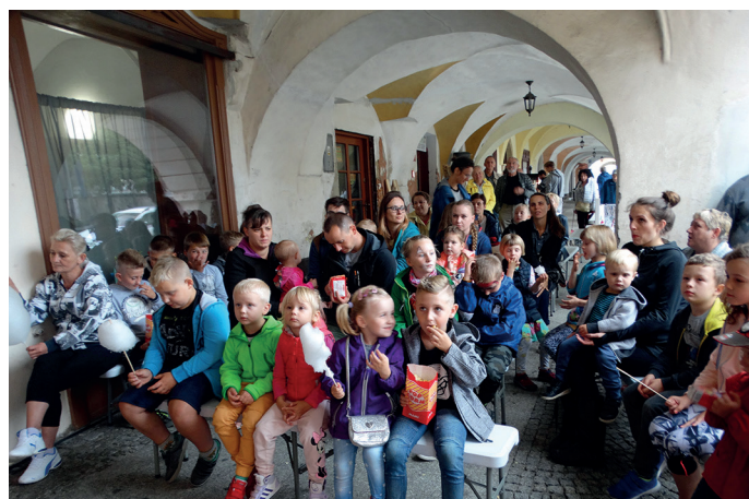
III POLSKO - CZESKIE spotkanie teatrów lalkowych „Łądecki HUMPTY DUMPTY”