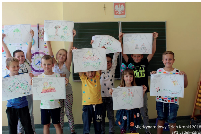
Międzynarodowy Dzień Kropki 2018 SP1 Lądek-Zdrój