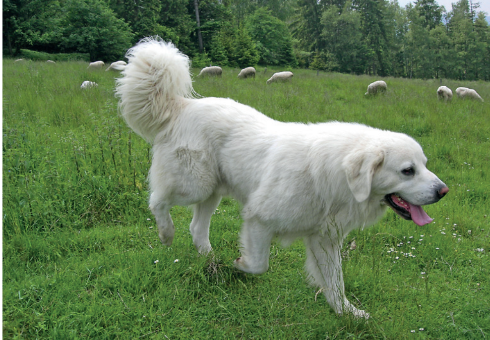
Fot. 10. Owczarek podhalański opiekujący się stadem owiec w Beskidzie Śląskim