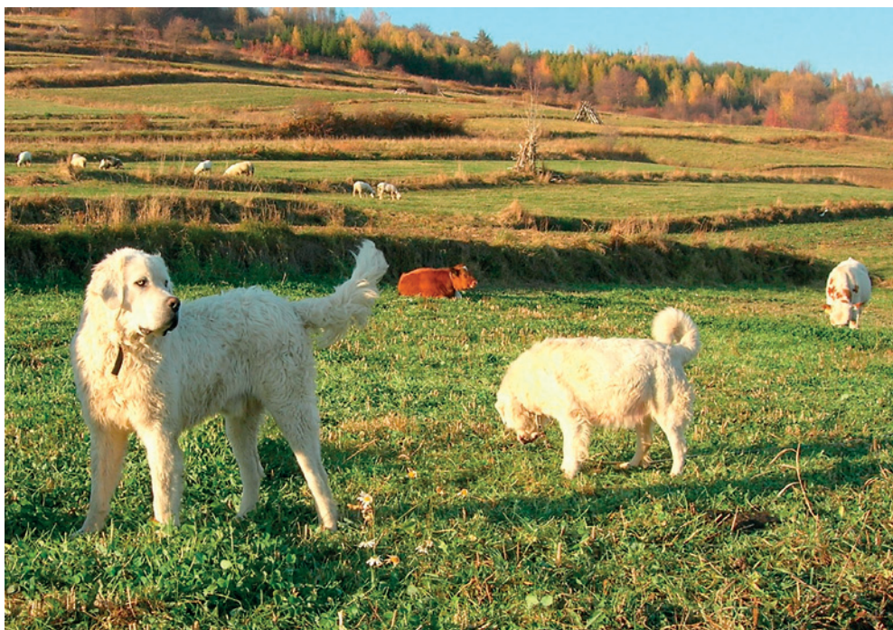
Fot. 11. Dwa owczarki podhalańskie pilnujące stada bydła w Beskidzie Śląskim