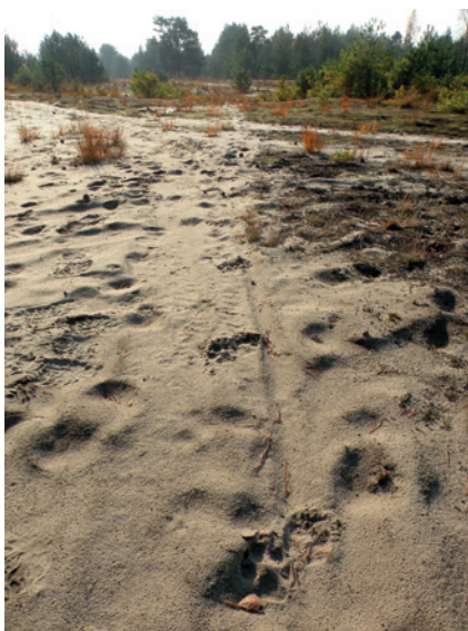
Fot. 6. Ciąg tropów wilka na drodze leśnej. Dokumentacja fotograficzna powinna obejmować także ujęcia tropów wraz z otoczeniem

a w konsekwencji do nieuznania szkody jako spowodowanej przez wilki. Zwierzęta ranne należy jak najszybciej zaopatrzyć weterynaryjnie.