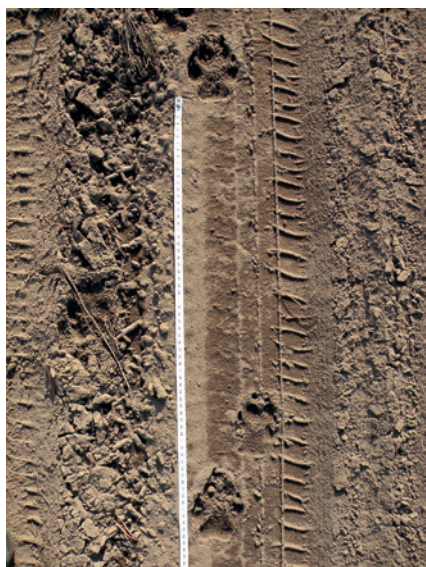
Fot. 5. Pomiar odległości pomiędzy tropami wilka