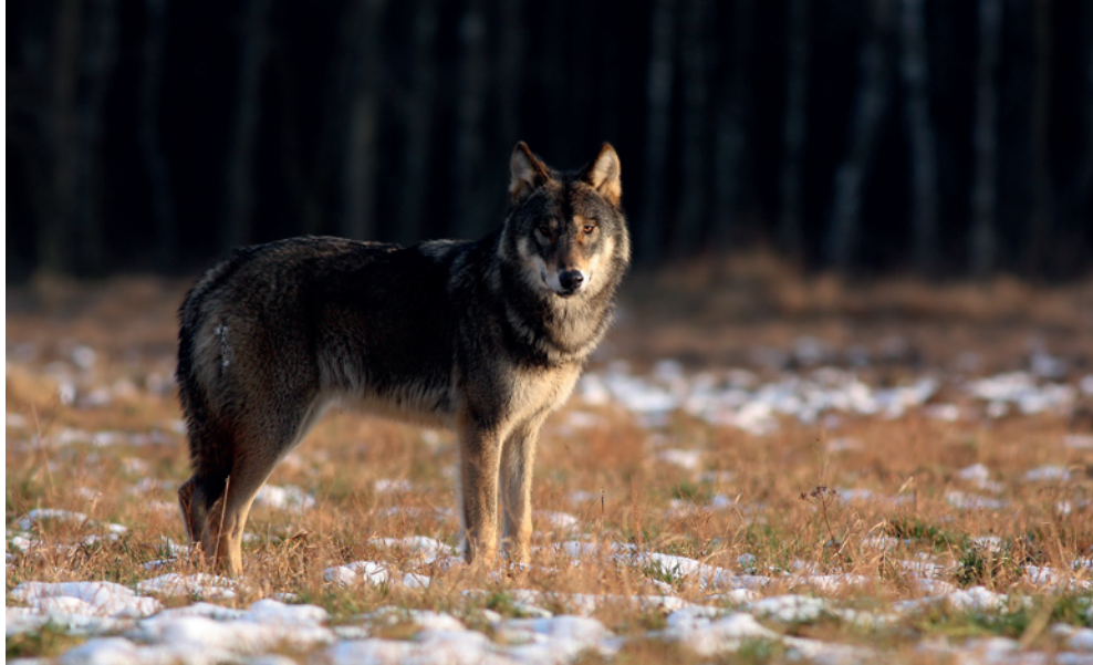
Fot. 1. Wilk w szacie zimowej

dorosłych samców to około 40–45 kg, a samic średnio 35 kg. Wilki zamieszkujące Polskę mają najczęściej umaszczenie płowo-beżowe, z brązowo-czarnym grzbietem i mocno rudym tyłem uszu i głowy. Zdarzają się osobniki jaśniej ubarwione lub ciemniejsze (zawsze jednak tył głowy i uszu jest rudy), natomiast wilki jednolicie czarne lub białe w Polsce nie występują. Młode, niespełna roczne osobniki są ciemniejsze od dorosłych. W zimie wilki mają bardzo grubą i puszystą sierść (Fot. 1), latem jest ona znacznie cieńsza (Fot. 2). Sprawia to, że zimą wilki wydają się o wiele większe niż są w rzeczywistości.