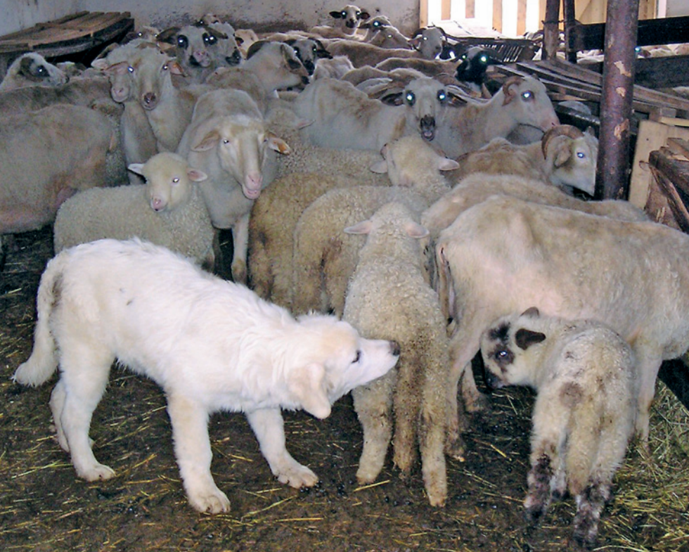
Fot. 12. Młody owczarek podhalański socjalizuje się ze stadem owiec w owczarni

chu poszczególnych osobników. Jak każdy młody pies, nasz owczarek będzie potrzebował sporo ruchu, dlatego codziennie trzeba wypuszczać go z kojca na pastwisko, aby się wybiegał.