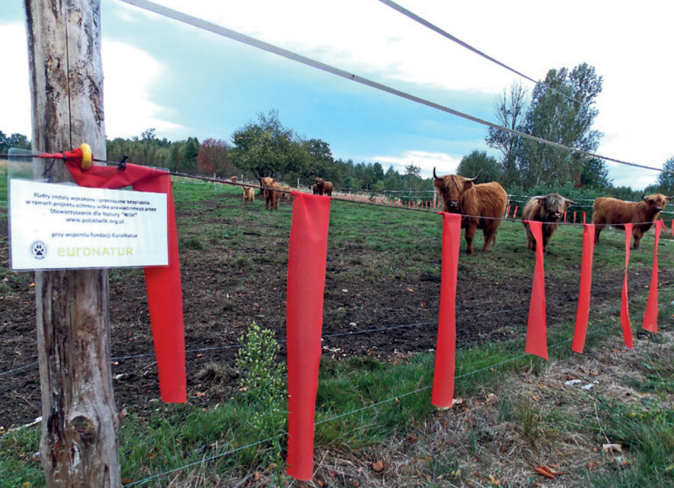
Fot. 15. Kombinacja pastucha elektrycznego i fladr chroniąca bydło w Borach Dolnośląskich

wysokości 70–75 cm nad ziemią. Pastuch składa się z trzech linek (ewentualnie taśm), najniższa linka wisi 15 cm nad gruntem (tam gdzie kończą się wstążki fladr), druga linka na tej samej wysokości co sznurek, do którego przyszyte są fladry, natomiast trzecia linka na wysokości 100 cm nad gruntem. Wyniki testów wskazują, iż jest to metoda 2–10 razy bardziej skuteczna niż fladry lub pastuch stosowane oddzielnie. Kombinację pastucha elektrycznego i fladr stosuje się też w zachodniej Polsce, do ochrony bydła i owiec (Fot. 15).