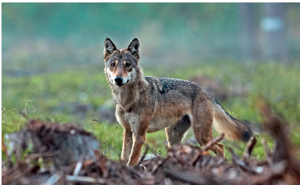
Fot. 2. Wilk w szacie letniej

dorosłych samców to około 40–45 kg, a samic średnio 35 kg. Wilki zamieszkujące Polskę mają najczęściej umaszczenie płowo-beżowe, z brązowo-czarnym grzbietem i mocno rudym tyłem uszu i głowy. Zdarzają się osobniki jaśniej ubarwione lub ciemniejsze (zawsze jednak tył głowy i uszu jest rudy), natomiast wilki jednolicie czarne lub białe w Polsce nie występują. Młode, niespełna roczne osobniki są ciemniejsze od dorosłych. W zimie wilki mają bardzo grubą i puszystą sierść (Fot. 1), latem jest ona znacznie cieńsza (Fot. 2). Sprawia to, że zimą wilki wydają się o wiele większe niż są w rzeczywistości.