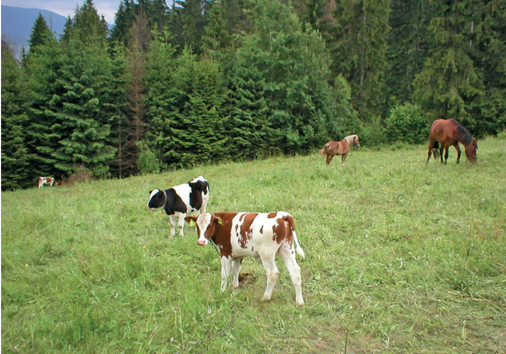
Fot. 8. Bydło i konie pozostawione bez nadzoru na leśnej polanie w Beskidzie Śląskim. Taki sposób wypasu zwiększa ryzyko ataku wilków