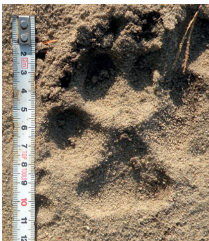
Fot. 4. Pomiar długości tropu wilka

Wilk to zwierzę palchochodne, chodząc opiera się tylko na czterech palcach, chronionych od spodu twardymi, zgrubiałymi poduszkami oraz na poduszce międzypalcowej, ustawionej za palcami. Trop dorosłego wilka jest duży (dł. 11–12 cm, szer. 9–10 cm), wydłużony i symetryczny (Fot. 3 i 4). Na końcach palców umiejscowione są pazury. Łapa przednia jest większa od tylnej o około 1 cm. Poduszka międzypalcowa przedniej łapy ma niewielkie sercowate wcięcie z tyłu. W łapie tylnej wcięcia brak.