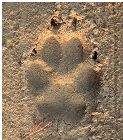
Fot. 3. Odbicie przedniej łapy wilka