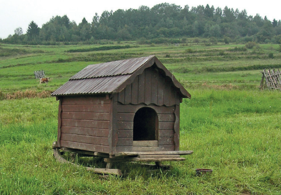
Fot. 13. Buda służąca za schronienie dla owczarka podhalańskiego na pastwisku w Beskidzie Śląskim. Posadowienie budy na płozach ułatwia jej transport

Owczarki podhalańskie mają długą sierść, która wymaga regularnej pielęgnacji, powinno się je zatem szczotkować raz w tygodniu. Dłuższe włosy za uszami i na łapach można rozczesać grzebieniem z metalowymi zębami. Owczarki linieją dwa razy w roku. W tym okresie zaleca się częstsze szczotkowanie psa. W trakcie pielęgnacji zwracać należy szczególną uwagę na wszelkie zmiany skórne, a także dokładnie sprawdzać uszy i oczy. Przy okazji warto skontrolować skórę psa pod kątem występowania pasożytów zewnętrznych.